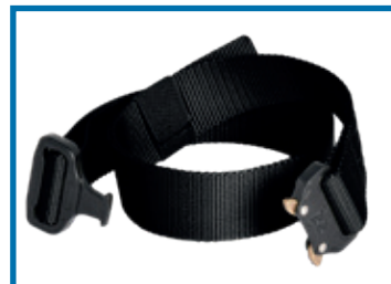
F9: cintura opzionale / belt optional